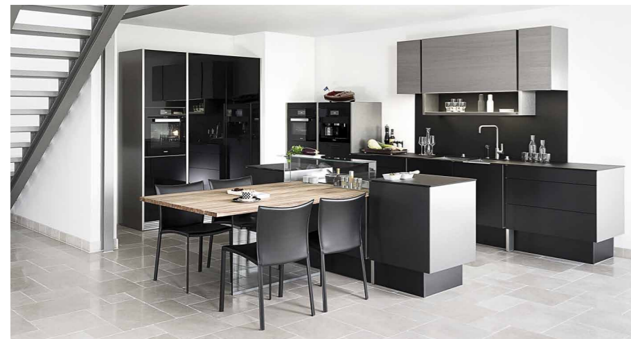
Nová verze kuchyně Porsche design P'7350 strhává pozornost a výrobce, firma Poggenpohl, získal Plus X Award za nejlepší produkt roku

S e skvělým týmem lidí má čas věnovat se i svým koníčkům a cestou na veletrhy nábytku zakotvit na pár večerů ve vinařství, aby okusil exkluzivní vína, může přemýšlet o směřování firmy při jízdě na Harleyi, nebo si jen tak vychutnat dobrý doutník. Každopádně tento zvědavý požitkář s dobrým vkusem a citem pro obchod vozí kvalitní design do Prahy už dvacet let a stále přichází s něčím novým.