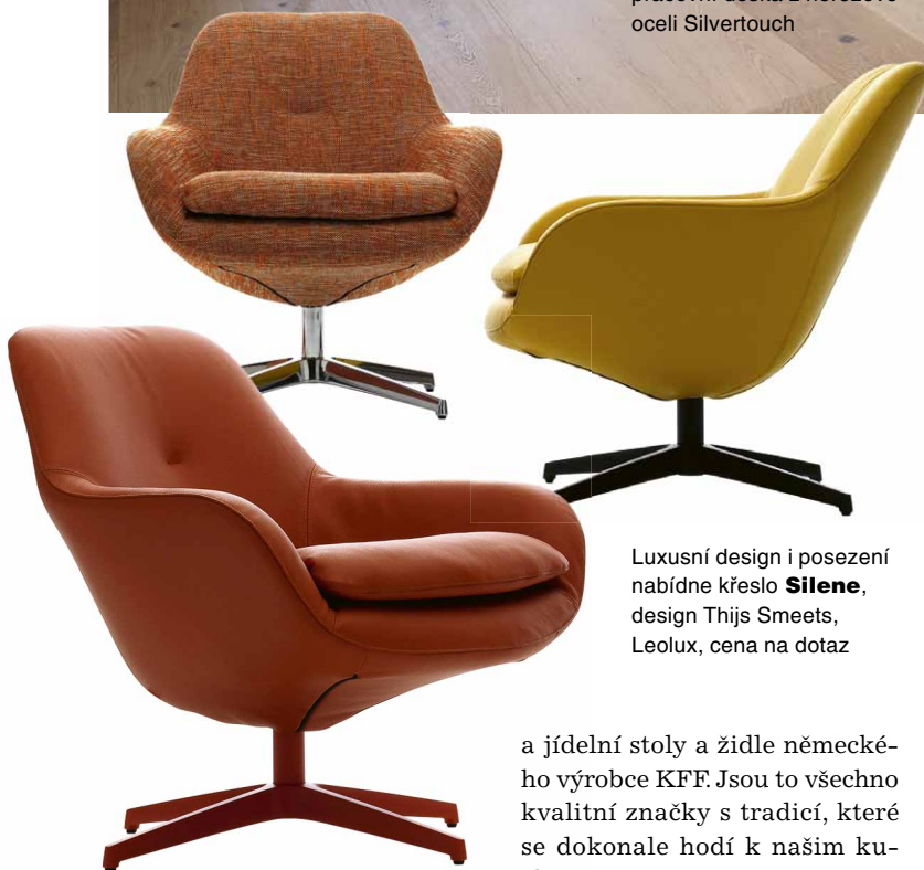
Luxusní design i posezení nabídne křeslo Silene , design Thijs Smeets, Leolux, cena na dotaz

a jídelní stoly a židle německého výrobce KFF. Jsou to všechno kvalitní značky s tradicí, které se dokonale hodí k našim kuchyním.