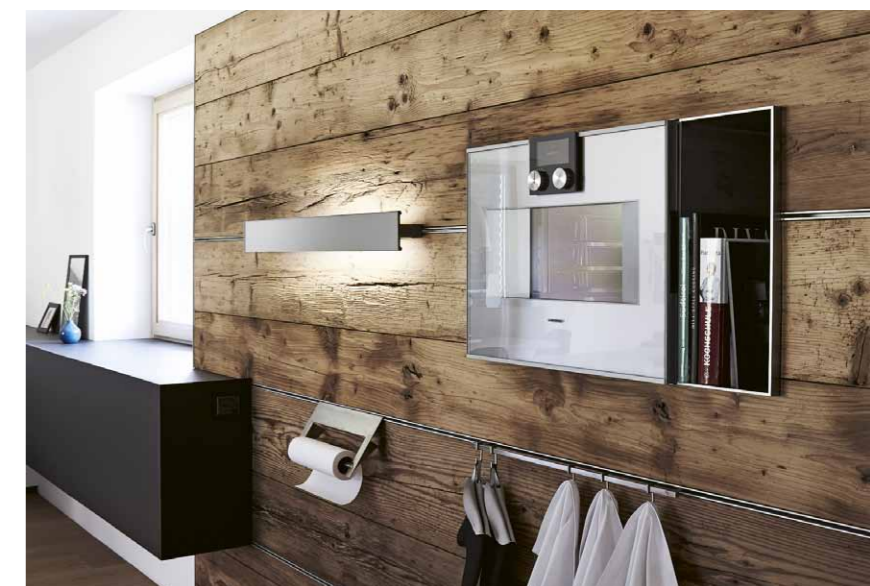
Kuchyňská sestava Eggersmann je vybavená špičkovými spotřebiči značky Gaggenau

Co se týká kuchyní, jsou to špičkové německé značky Eggersmann, Poggenpohl a Beeck Küchen. Každá z těchto značek oslovuje trochu jiného