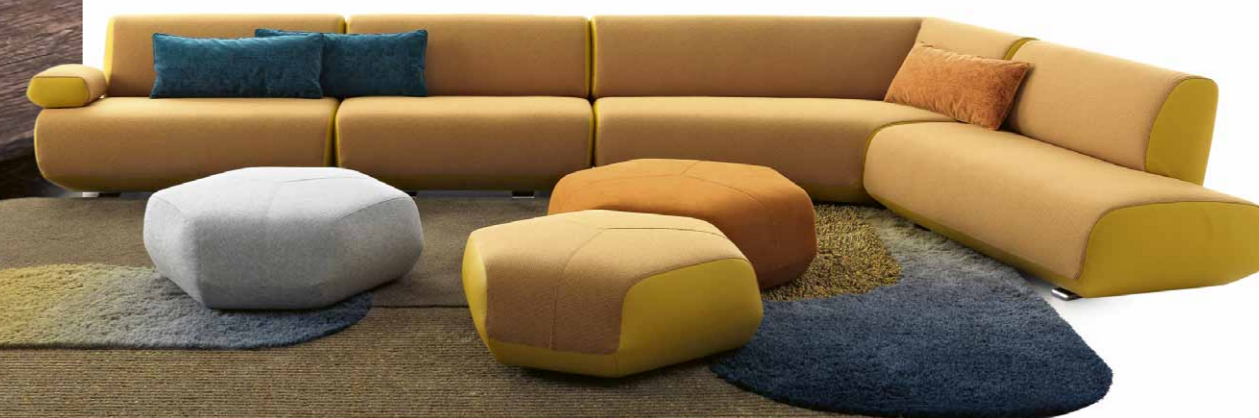
Modulární sedací souprava Guadalupe , design Christian Werner, Leolux, cena na dotaz

klínta, všechny však nabízejí kvalitu, trvanlivost a stoprocentní funkčnost. Samozřejmě jsou exkluzivní materiály s kováním a výbavou v nejvyšší kvalitě. Dále nabízíme sedací nábytek holandské značky Leolux a italské značky Prianera