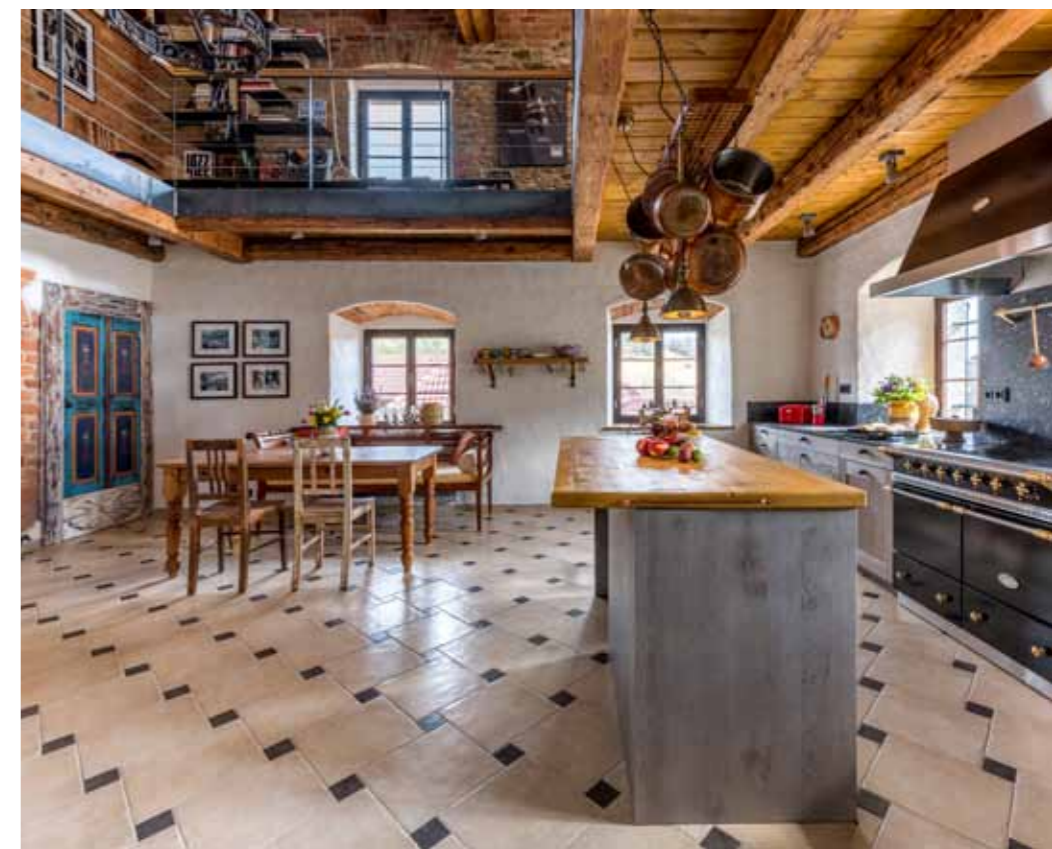
Linii schodiště kopíruje plakátový plavec od Gérarda Courbouleix-Dénériaize, který zároveň ukazuje cestu k jedné z nejdůležitějších částí domu – do kuchyně

Asi ano. Amerika je úžasná země. Možná proto, že nemá historii. Ta totiž někdy tak trochu svazuje. Víš, co tím chci říct? To, že by člověk chtěl dělat něco jinak, ale nemůže, protože se to vždycky dělalo tak a tak, všichni to tak dělají a všechno, co nějak vybočuje, je špatně. V Americe je to naopak. „Chceš si to dělat po svém? Výborně!“ Tam jsou z toho všichni nadšení. No a my jsme vlastně v té naší chalupě zkombinovali takový euroamerický přístup. Na jedné straně jsme se chtěli pusťt do rekonstrukce něčeho starého, co má v sobě historii. Zároveň jsme podnikli něco, u čeho by si asi většina Evropanů ťukala na čelo. Jezdit z New Yorku na chalupu někde do Česka? Blázní!