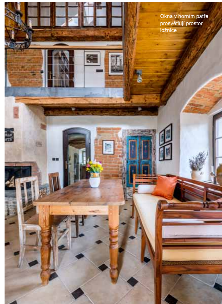
Okna v horním patře prosvětlují prostor ložnice

Byli jsme si vědomi, že vzhledem k historii objektu můžeme lehce šlápnout vedle. Volba padla na kuchyň značky Beeck Küchen s masivním provedením dvířek – sukátý drásaný dub. Pracovní deska je ze žuly Azul noche s matnou povrchovou úpravou. U spotřebičů je stěžejní smaltovaný sporák se dvěma troubami a sklokeramickou varnou deskou.